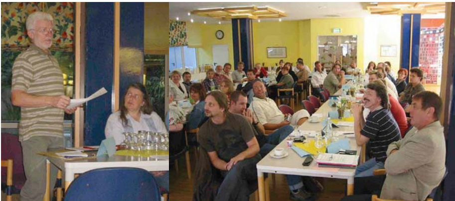
Großes Engagement bei der ersten Tagung der AG-MAV -Ruhr-Lippe zum Thema „Veränderungsprozesse“

In Westfalen gibt es annähernd geschätzt 200 Mitarbeitervertretungen in Kirche und Diakonie. Jede arbeitet für sich und hat ihre eigenen Probleme. Dies sollte anders werden. Deshalb hat sich 1996 die AG-MAV-Westfalen gegründet. Voller Titel: „Arbeitsgemeinschaft der Mitarbeitervertretungen im Diakonischen Werk der Evangelischen Kirche von Westfalen“ .